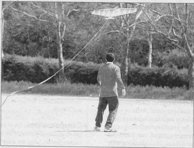
Exhibición de aeromodelismo en la UCAV, el año pasado.

A lo largo de todo el día los alumnos dispondrán de una barra en el exterior donde podrán adquirir bebidas y bocadillos.